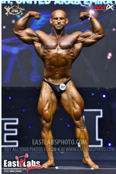
De frente, doble bíceps