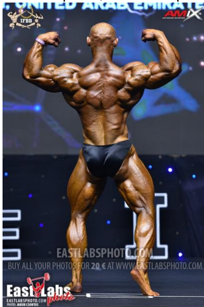
De espalda, doble bíceps