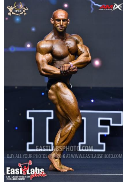
Lateral de pectorales