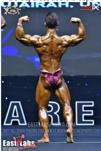
De espalda, doble bíceps