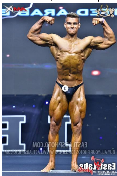
De frente, doble bíceps