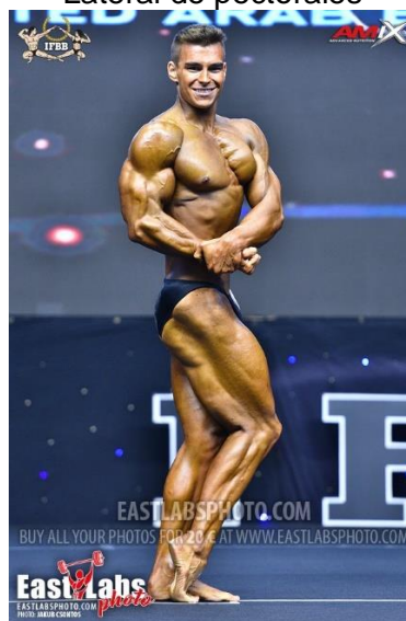
Lateral de pectorales